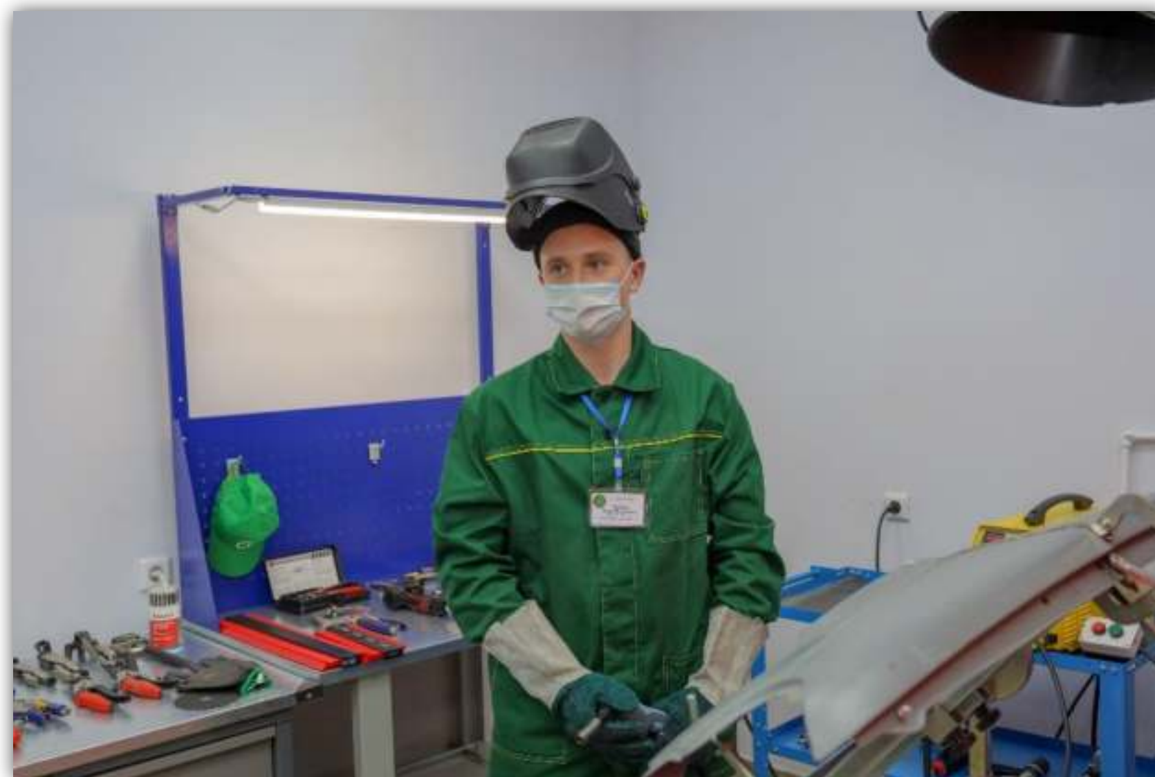
ФОТОГРАФИИ РАБОТАЮЩИХ ОБУЧАЮЩИХСЯ