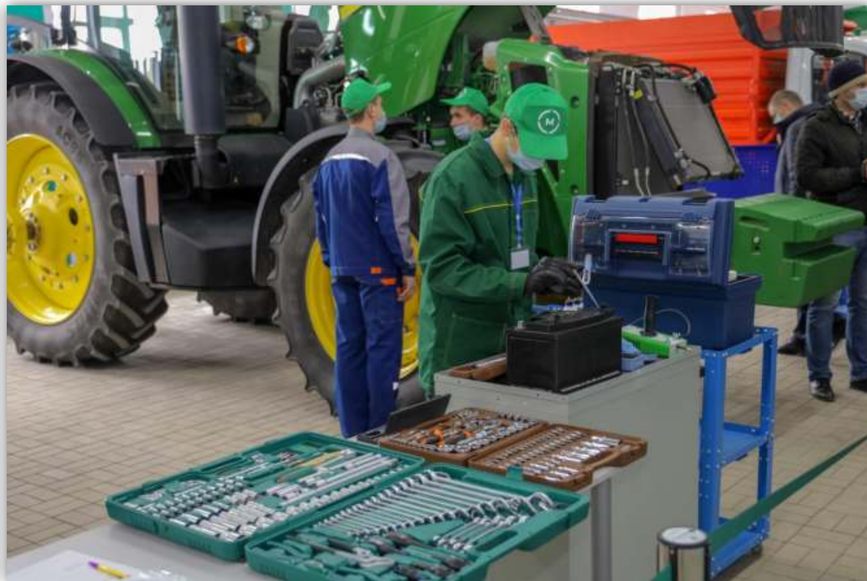
ФОТОГРАФИИ РАБОТАЮЩИХ ОБУЧАЮЩИХСЯ