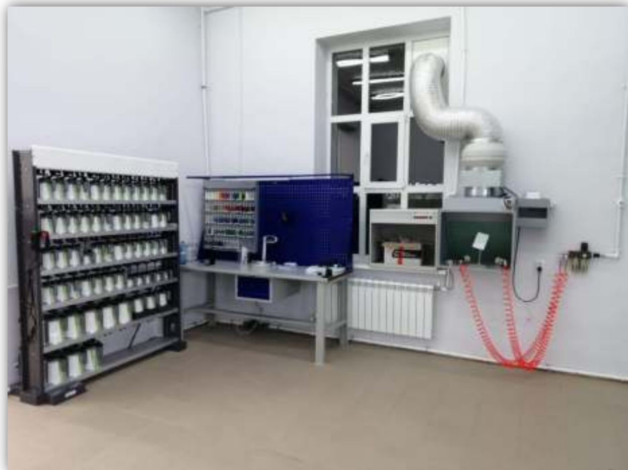
ФОТО РАБОЧЕГО МЕСТА