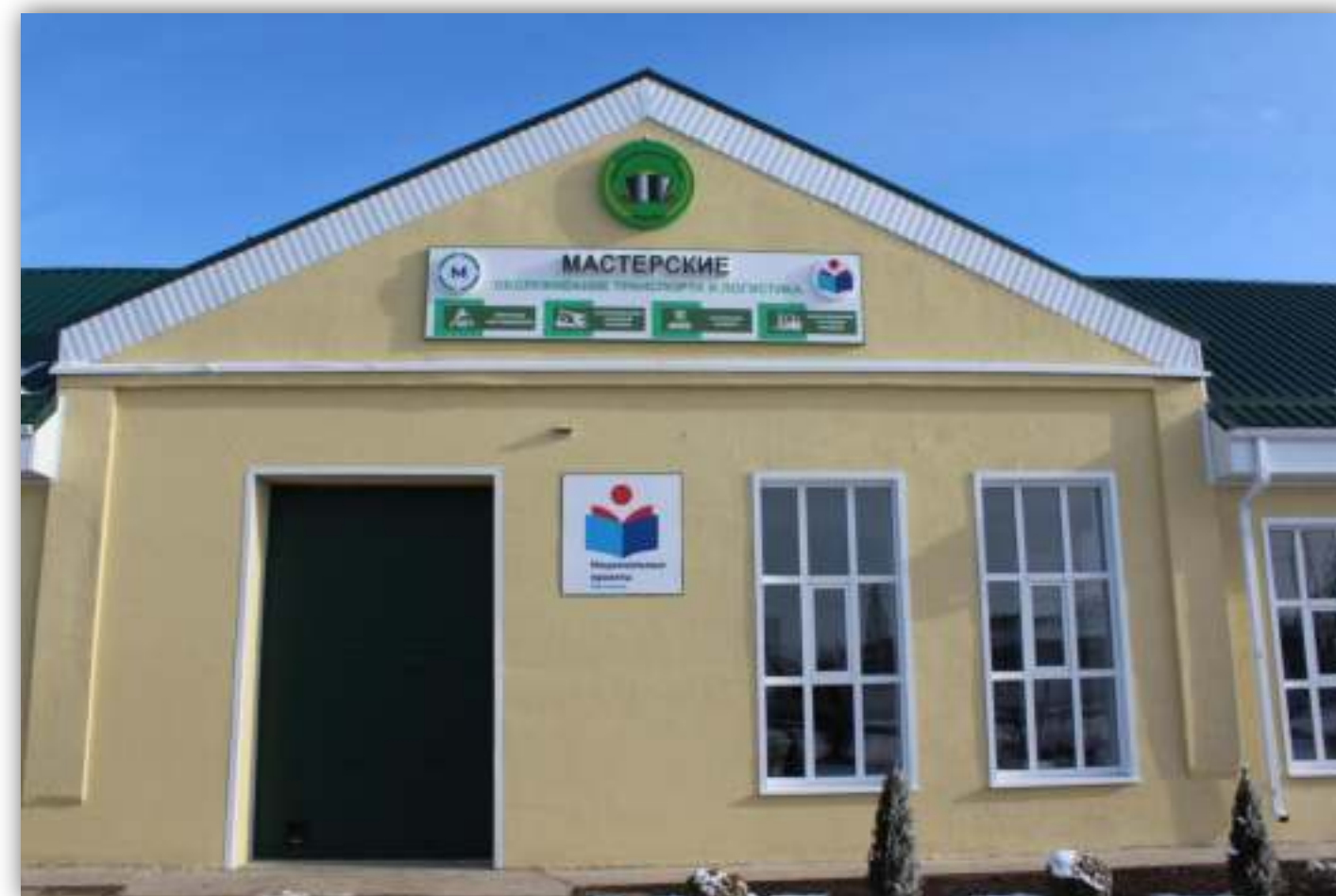
ФОТО ФАСАДА ЗДАНИЯ МАСТЕРСКИХ