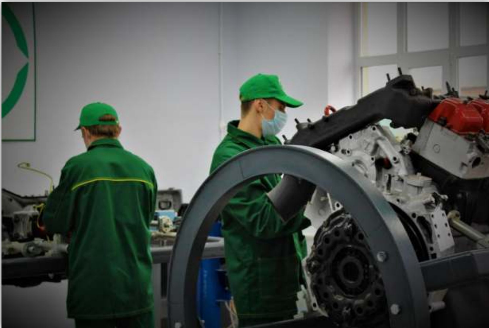
ФОТОГРАФИИ РАБОТАЮЩИХ ОБУЧАЮЩИХСЯ