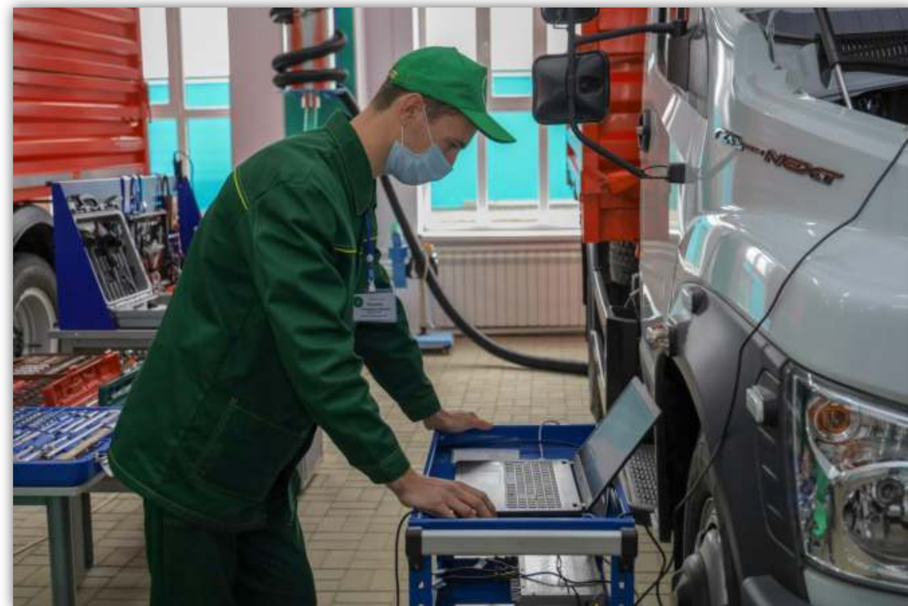
ФОТОГРАФИИ РАБОТАЮЩИХ ОБУЧАЮЩИХСЯ