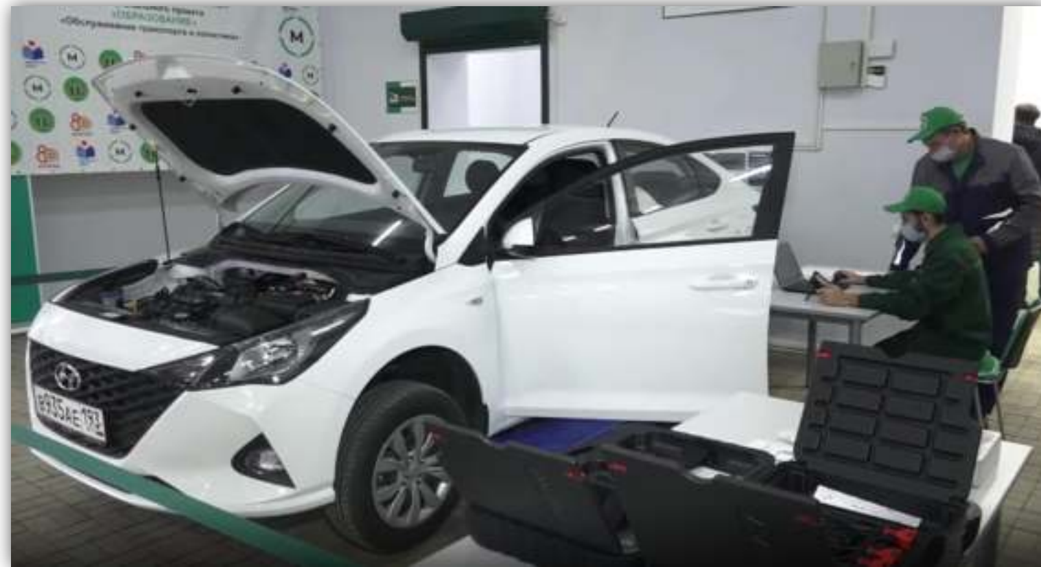
ФОТОГРАФИИ РАБОТАЮЩИХ ОБУЧАЮЩИХСЯ