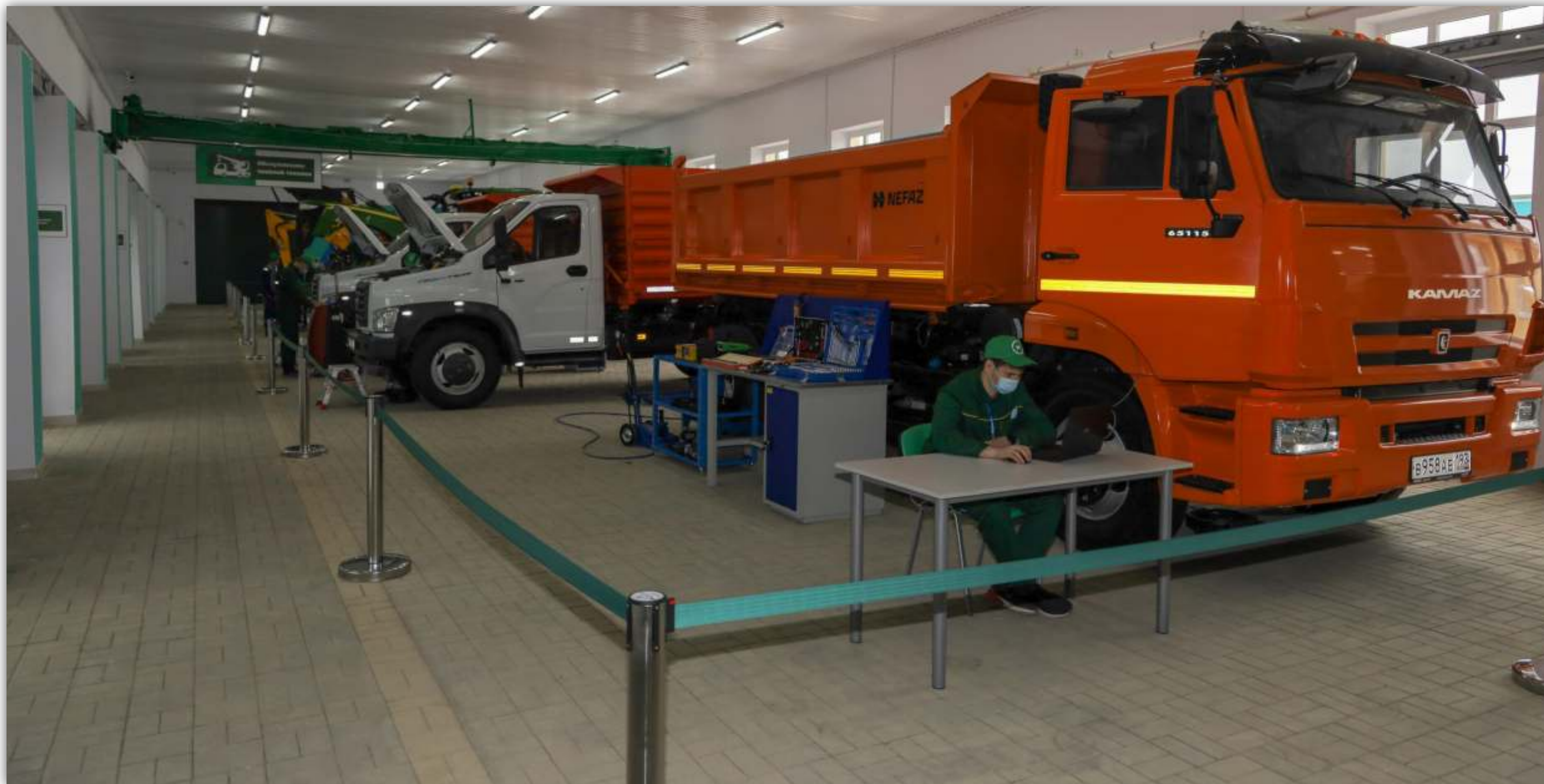
ПАНОРАМНАЯ ФОТОГРАФИЯ МАСТЕРСКОЙ