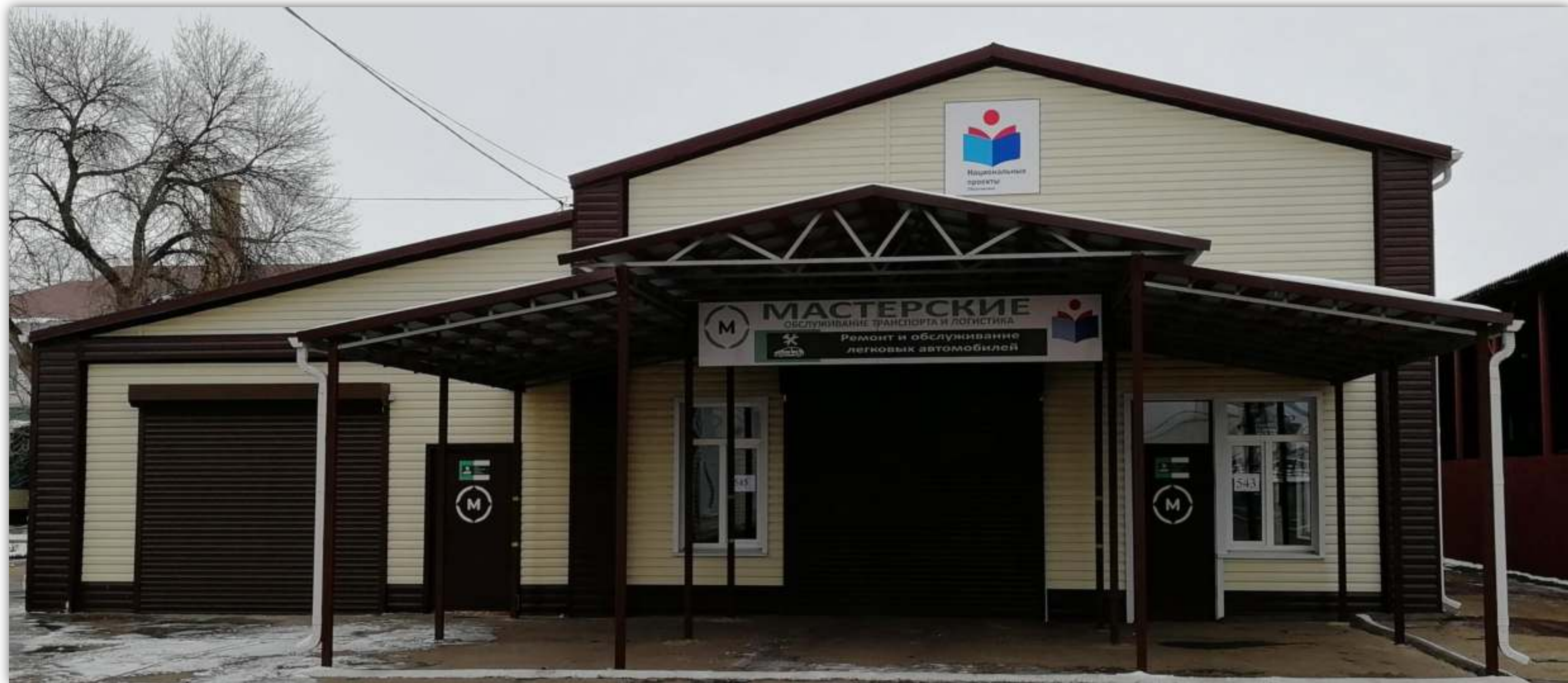
ФОТО ФАСАДА ЗДАНИЯ МАСТЕРСКИХ