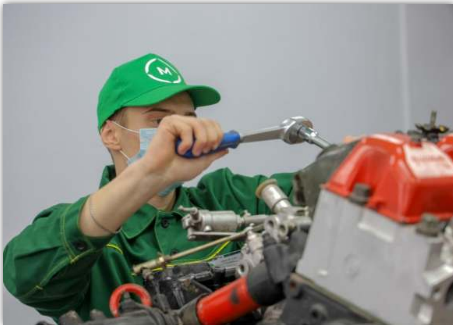
ФОТОГРАФИИ РАБОТАЮЩИХ ОБУЧАЮЩИХСЯ