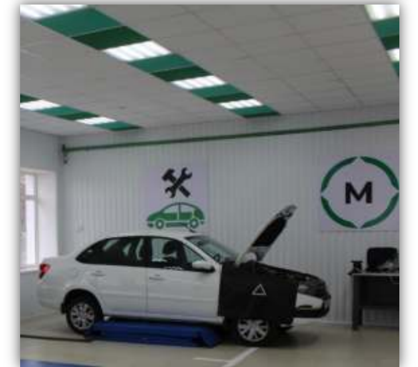
ФОТО ЭЛЕМЕНТОВ БРЕНДБУКА