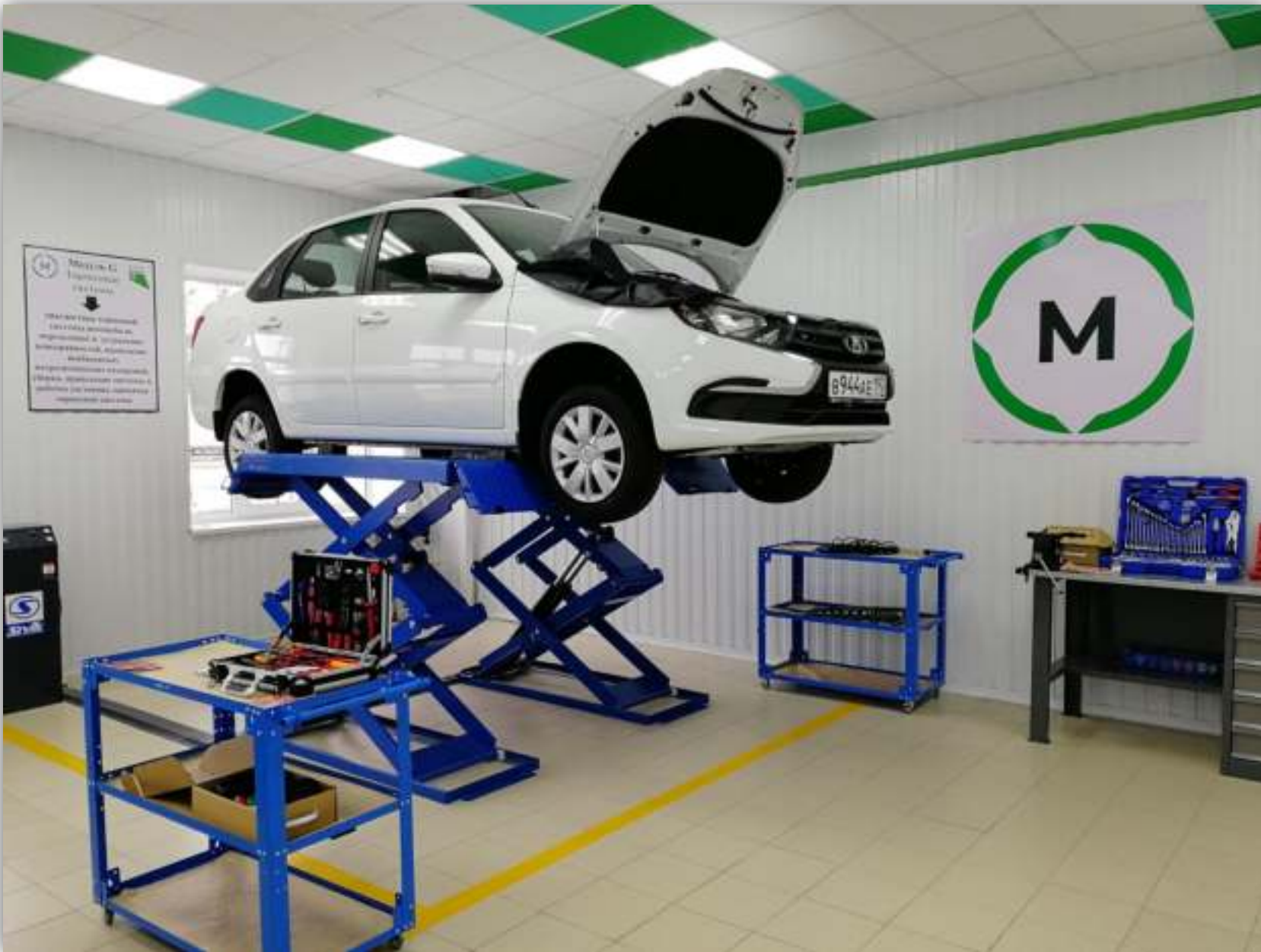
ФОТО РАБОЧЕГО МЕСТА