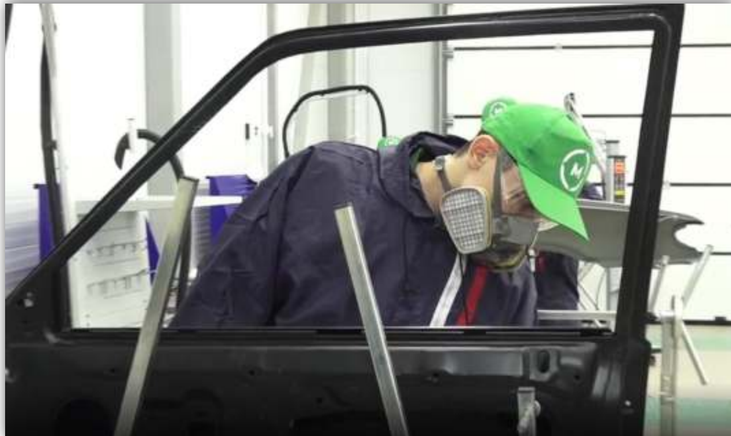
ФОТОГРАФИИ РАБОТАЮЩИХ ОБУЧАЮЩИХСЯ