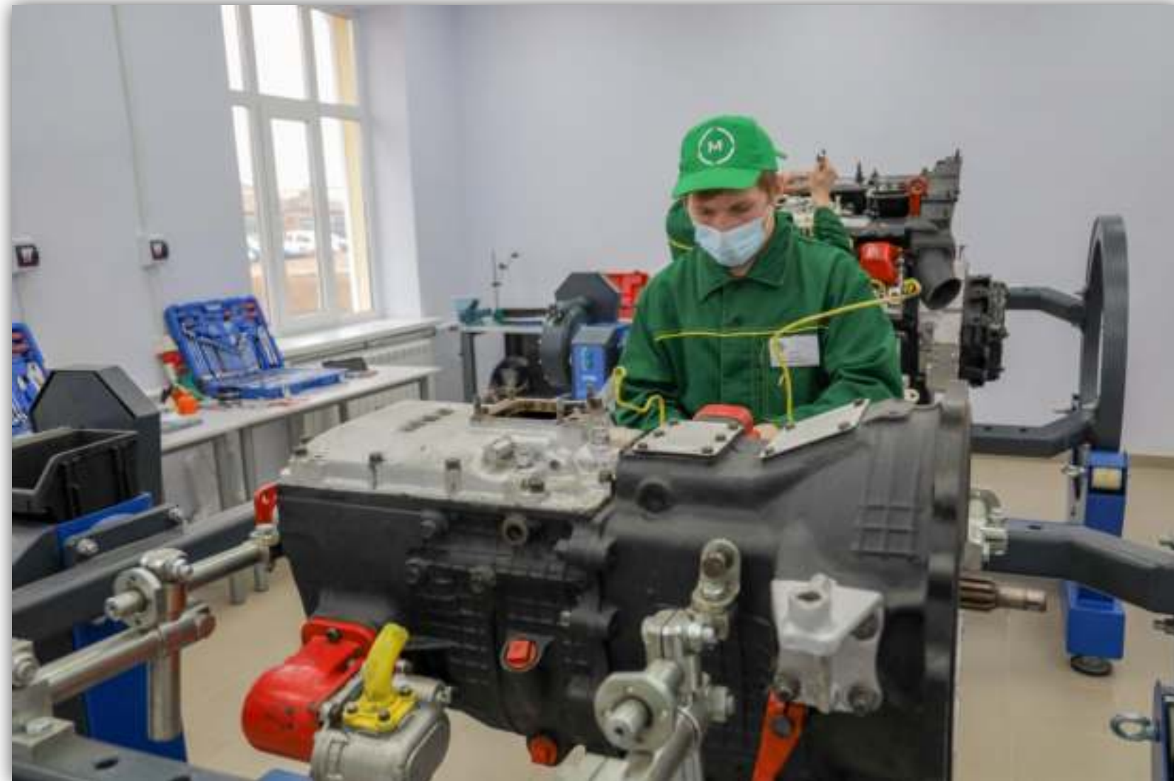
ФОТОГРАФИИ РАБОТАЮЩИХ ОБУЧАЮЩИХСЯ