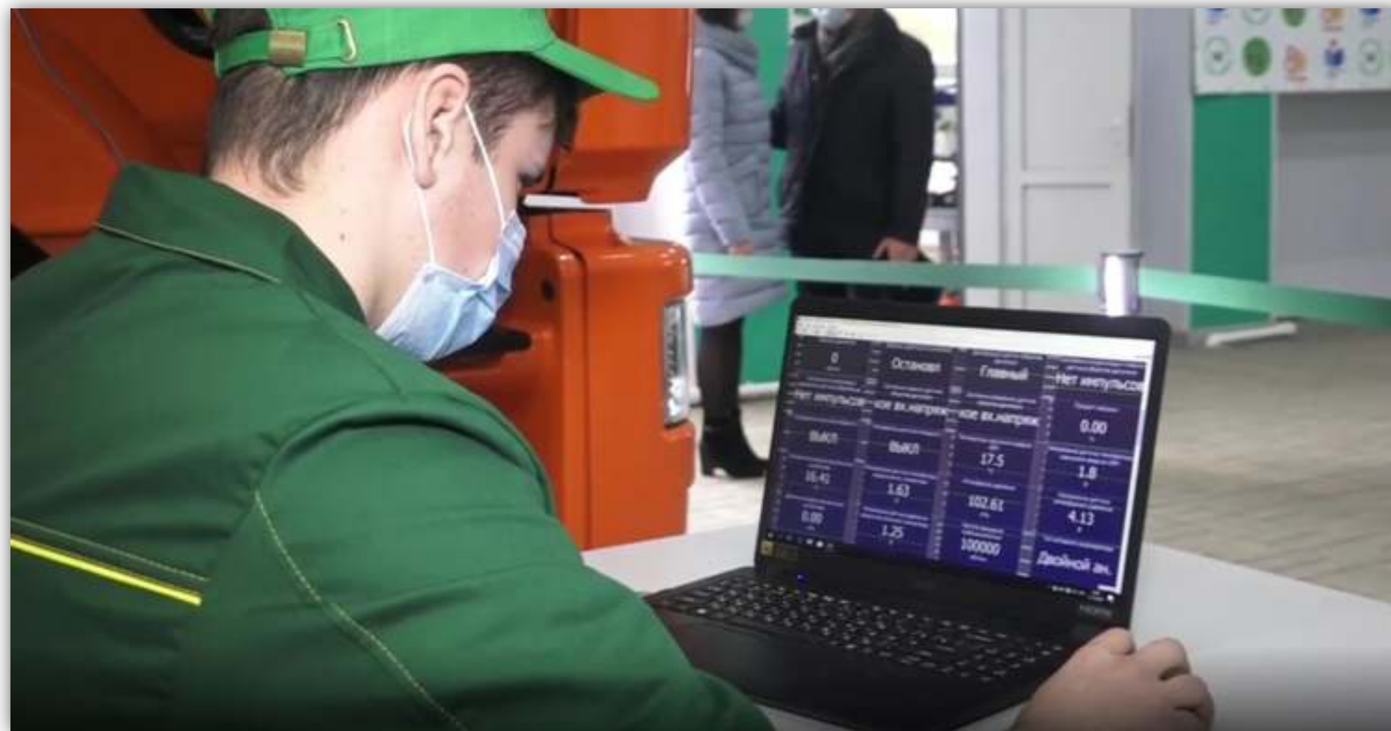
ФОТОГРАФИИ РАБОТАЮЩИХ ОБУЧАЮЩИХСЯ