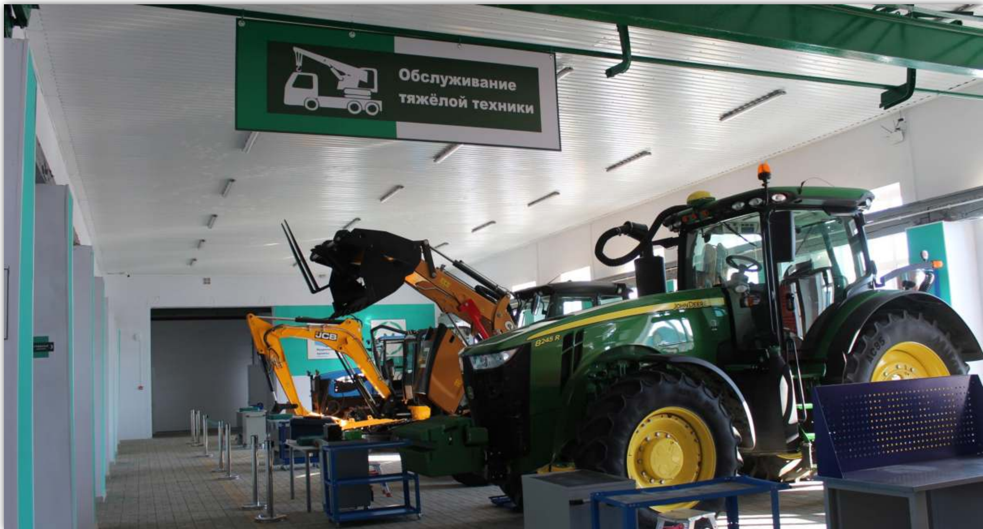
ПАНОРАМНАЯ ФОТОГРАФИЯ МАСТЕРСКОЙ