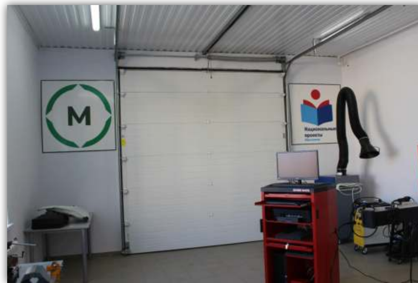
ФОТО ЭЛЕМЕНТОВ БРЕНДБУКА