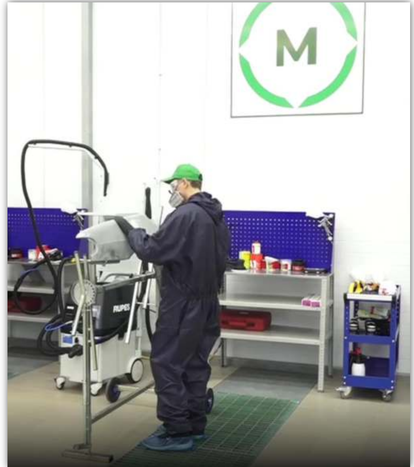
ФОТОГРАФИИ РАБОТАЮЩИХ ОБУЧАЮЩИХСЯ