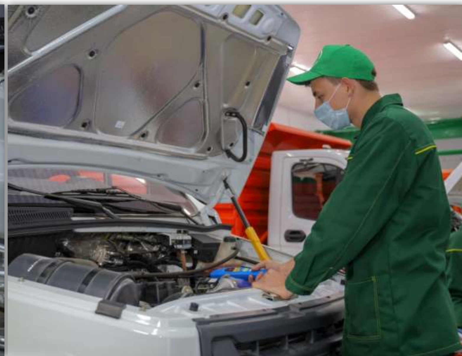
ФОТОГРАФИИ РАБОТАЮЩИХ ОБУЧАЮЩИХСЯ