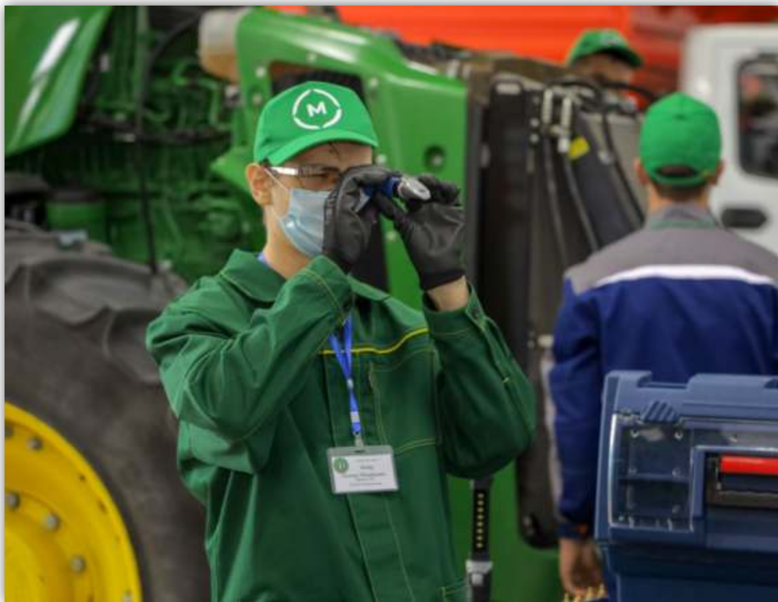
ФОТОГРАФИИ РАБОТАЮЩИХ ОБУЧАЮЩИХСЯ