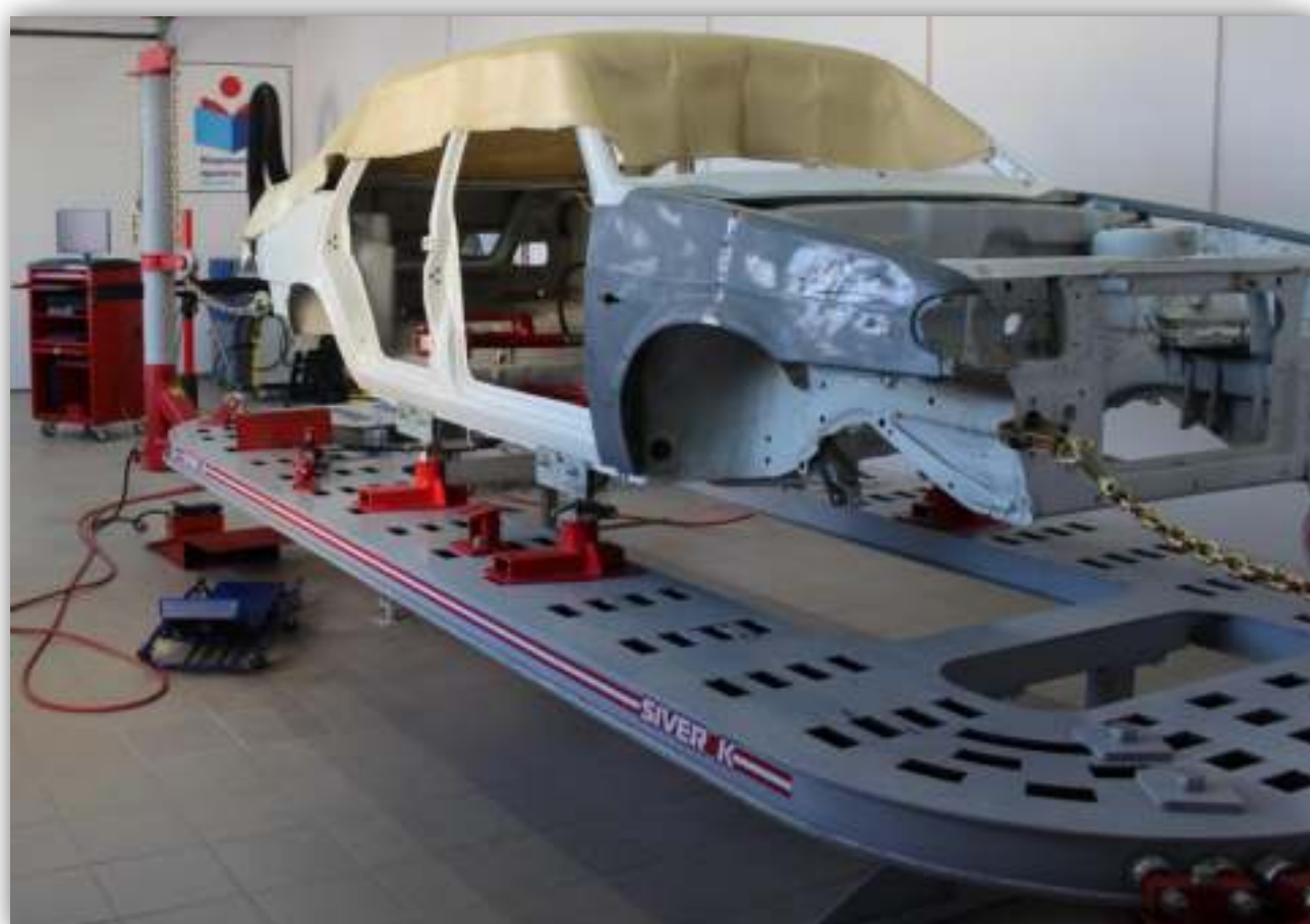
ФОТО РАБОЧЕГО МЕСТА