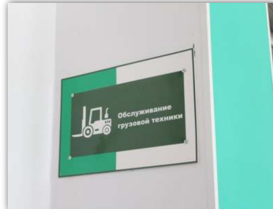
ФОТО РАБОЧЕГО МЕСТА