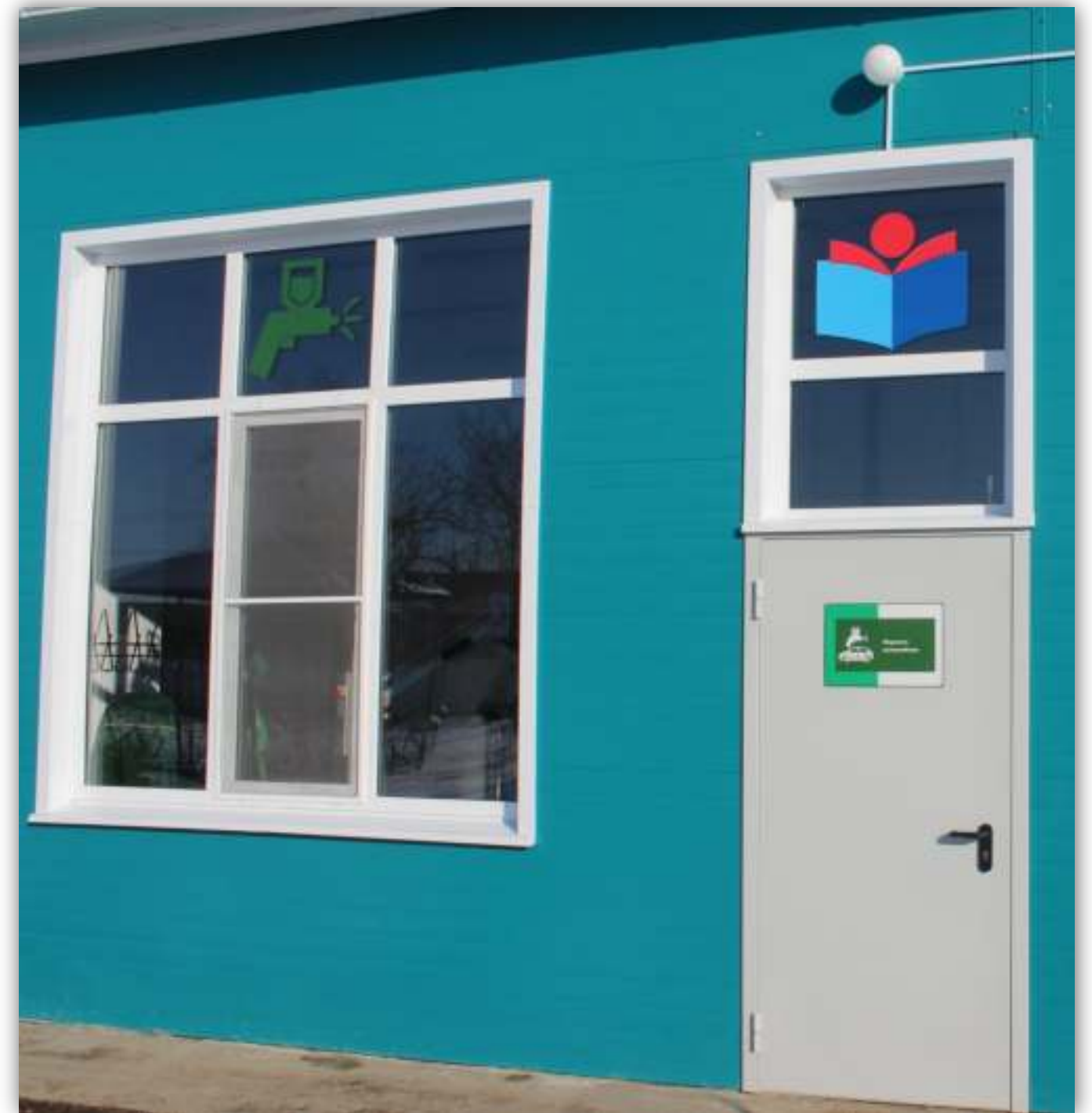
ФОТО ЭЛЕМЕНТОВ БРЕНДУКА