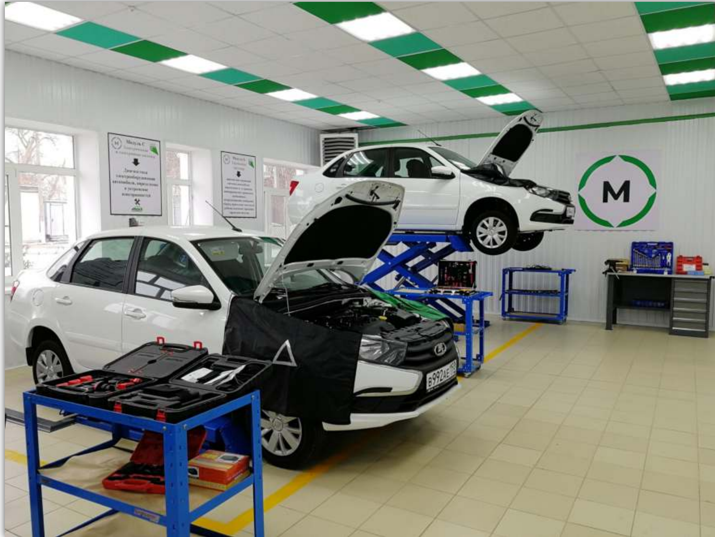
ПАНОРАМНАЯ ФОТОГРАФИЯ МАСТЕРСКОЙ