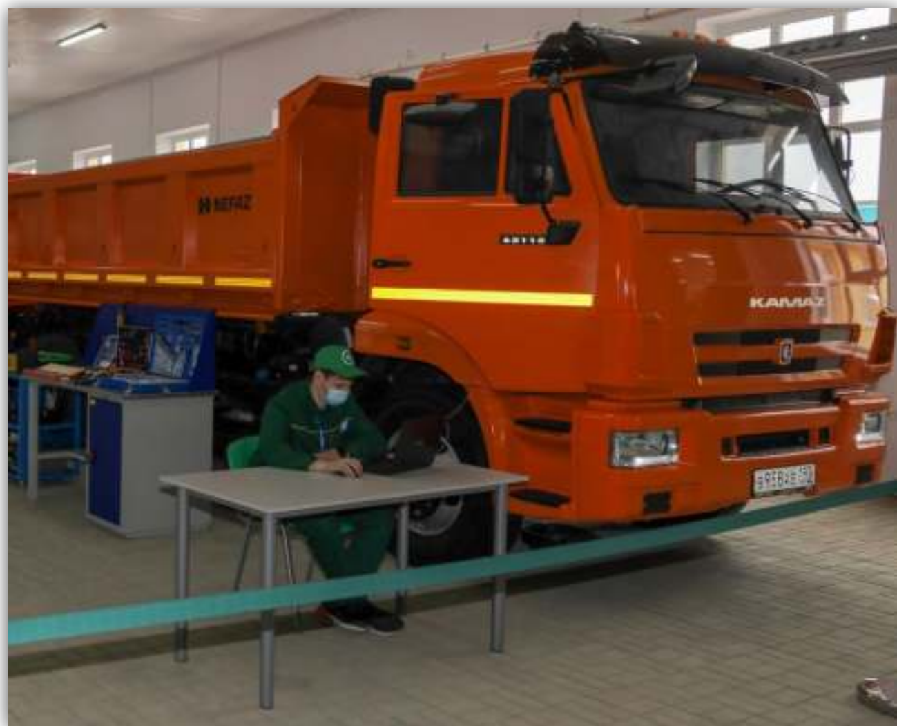
ФОТОГРАФИИ РАБОТАЮЩИХ ОБУЧАЮЩИХСЯ