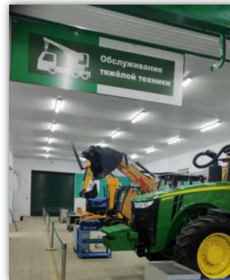
ФОТО РАБОЧЕГО МЕСТА