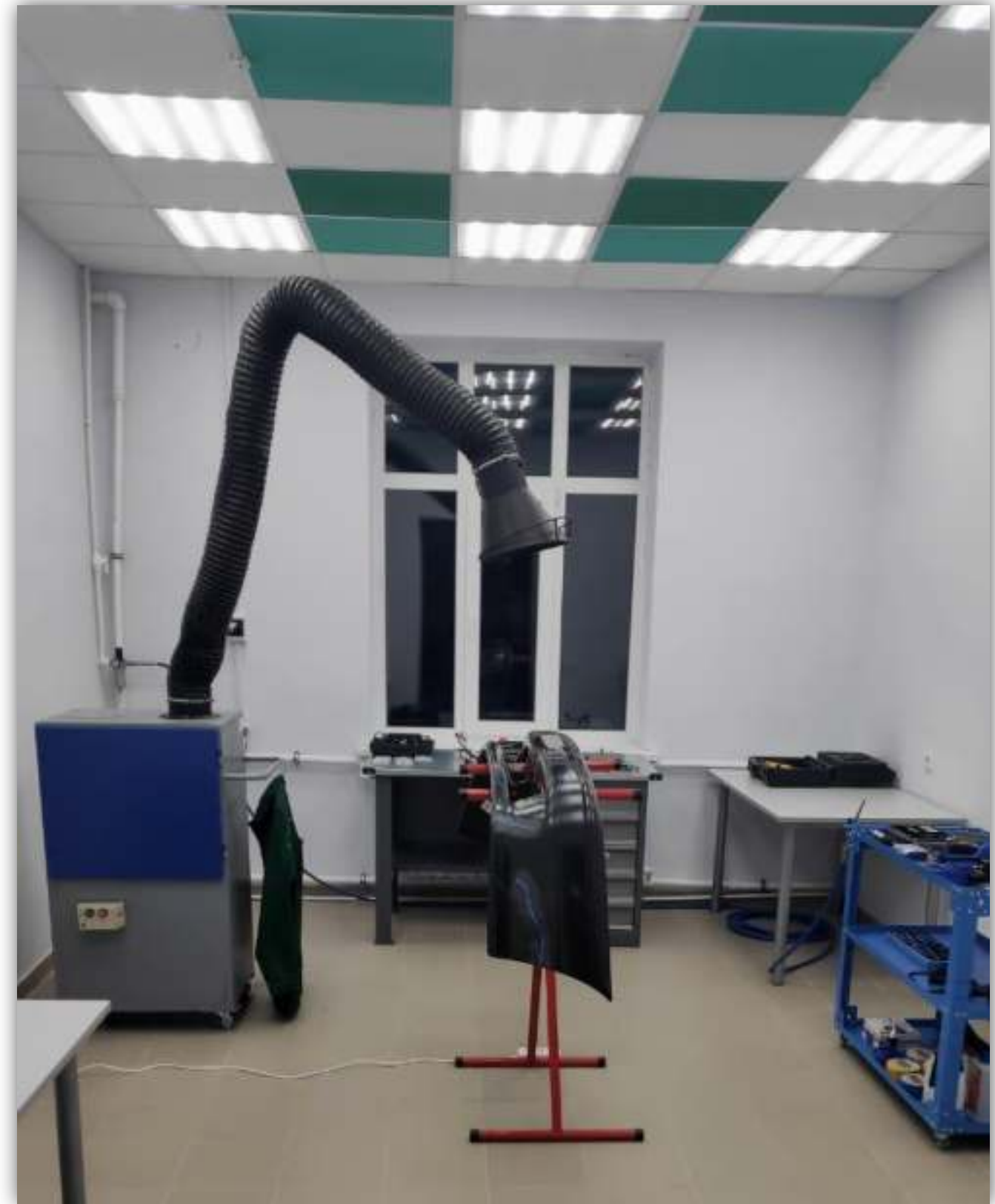
ПАНОРАМНАЯ ФОТОГРАФИЯ МАСТЕРСКОЙ